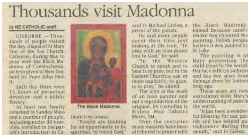
Fot. O popularności obrazu świadczą także wzmianki w nowozelandzkiej prasie.

Każda kolejna pielgrzymka Polaków nadawała tym samym temu papieskiemu prezentowi większe znaczenie i znaczny rozgłos. Nowozelandzka kopia obrazu Pani Jasnogórskiej zaczęła wojażowanie po obu nowozelandzkich Wyspach. Prasa coraz częściej donosiła o tych wydarzeniach.