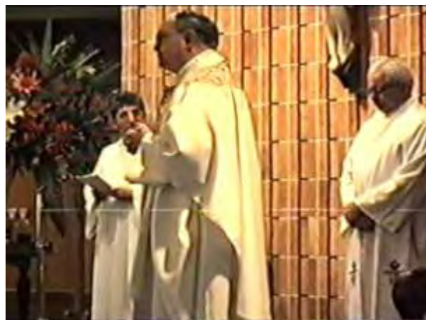
Fot. Biskup Denise Brown w hamiltonskiej katedrze serdecznie przywitał delegację Polaków

Kolejna pielgrzymka miała miejsce w Napier, w której licznie uczestniczyli także Polacy mieszkający w Hawke's Bay i dokąd przyjechała też bardzo liczna grupa Polaków z Wellington.