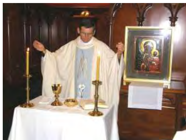
Fot. Nabożeństwo przy obrazie Czarnej Madonny w katedrze w Auckland, grudzień 2007