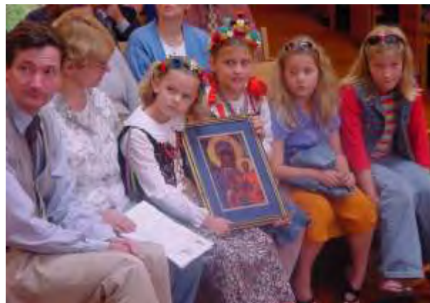
Fot. Parafii św. Patryka w Napier sprezentowano miniaturę obrazu Matki Boskiej Częstochowskiej.

Ostatnia do tej pory pielgrzymka, piąta z kolei, miała miejsce ponownie w Tokoroa w roku 2002. Wszystkie pielgrzymki aucklandzkiej wspólnoty polonijnej tradycyjnie organizowano w miesiącu październiku ze względu na przypadającą w tym czasie rocznicę wyboru Polaka na papieża.