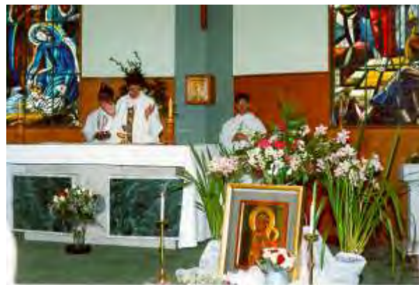
Fot. Tokoroa, październik 1998, pierwsza parafialna pielgrzymka