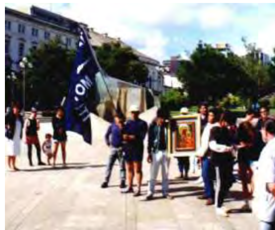
Fot. Zgromadzenie wiernych na placu Aotea w Auckland przed pierwszym wyjazdem obrazu do Motuti.