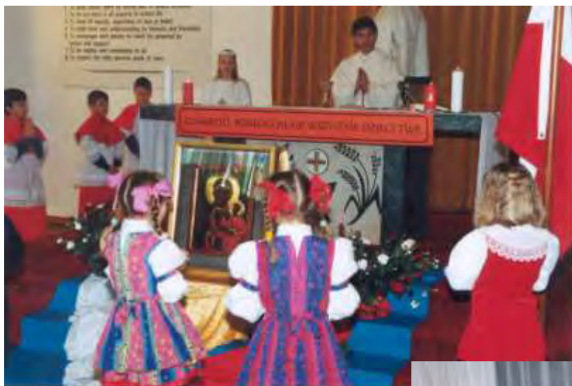
Fot. Obraz Janogórskiej Pani w polskim kościele w Auckland, wrzesień 1999.

Po okresie rezydowania obrazu w Tokora, przebywał on krótko w aucklandzkiej katedrze, po czym został ponownie zdeponowany w Motuti (Hokianga) w sanktuarium biskupa Pompallier, dokąd co roku przybywali liczni pielgrzymi z całego świata.