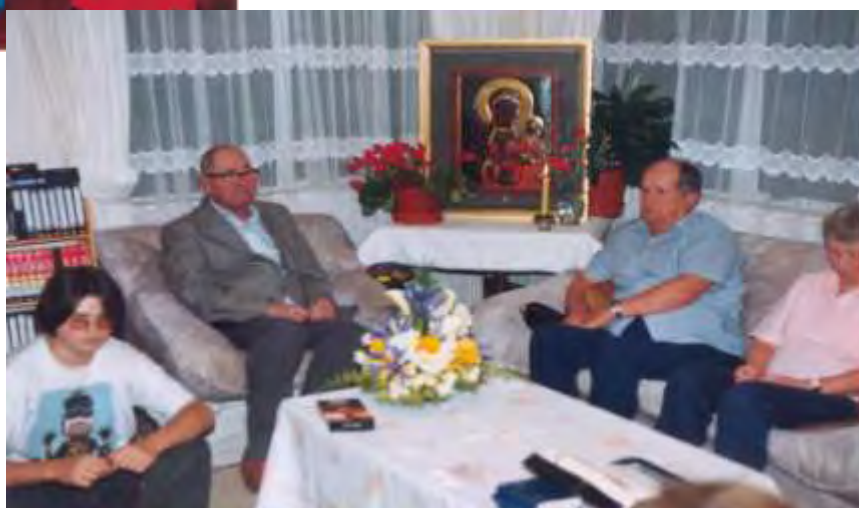
Fot. Obraz Czarnej Madonny w domu rodziny Sosna.

Po okresie rezydowania obrazu w Tokora, przebywał on krótko w aucklandzkiej katedrze, po czym został ponownie zdeponowany w Motuti (Hokianga) w sanktuarium biskupa Pompallier, dokąd co roku przybywali liczni pielgrzymi z całego świata.