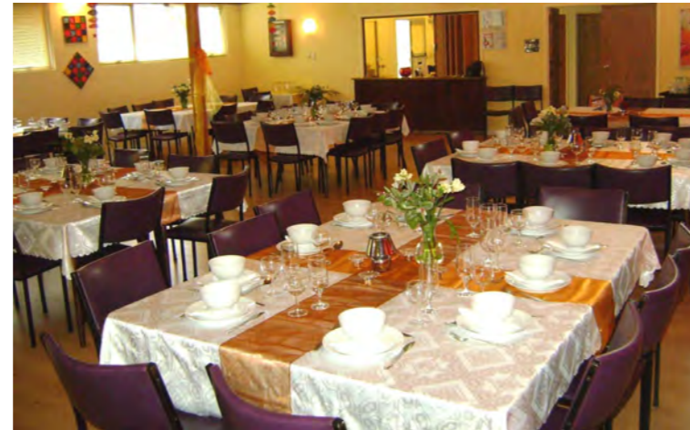
Więcej możliwości ustawiania stołów,

W międzyczasie zapraszamy do pomocy i udziału w naszych akcjach.