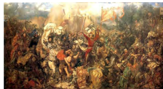
Bitwa pod Grunwaldem - Pędzla Jana Matejki

Komu należy przekazać tę wiedzę i historię to naszej najmłodszej generacji, która wyjechała z kraju jako małe dzieci i tym, które urodziły się poza granicami Polski. To im właśnie należy pokazać dzieje ojczyzny ich rodziców i dziadków, wujków i cioci.