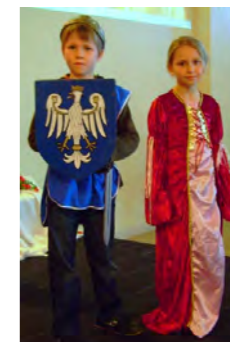
Zbyszko i Jagienka