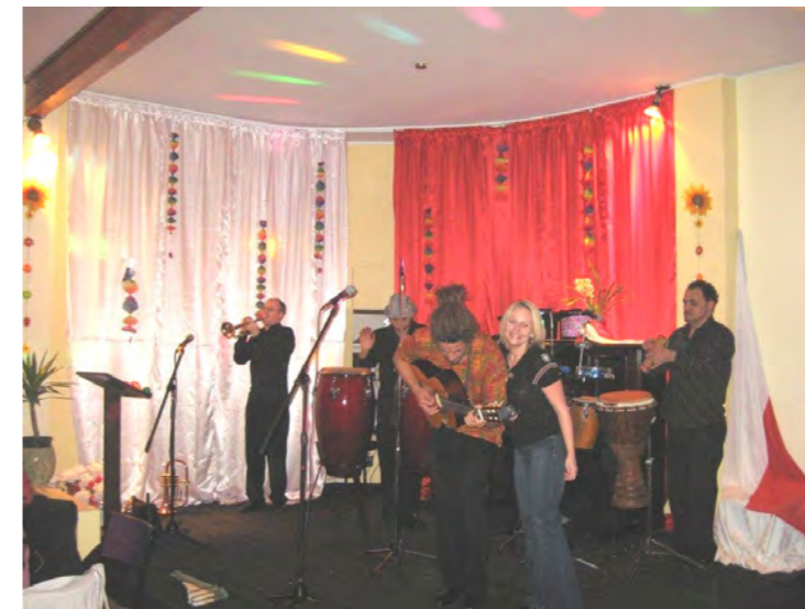
Zespół I latinosów

Tak, to nie pomyłka - tydzień wcześniej w naszym Domu zimową zabawę gulaszową organizowali Czesi i Słowacy, na którą przyszło również mnóstwo Polaków!